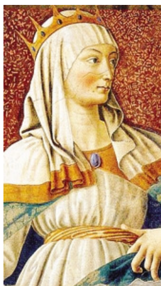
«Ester» di Andrea del Castagno

Numerosi gli eventi a ingresso gratuito, a Bergamo e in provincia, fino al 13 maggio: nell'in-