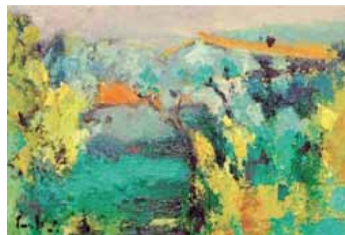
Lovere, Atèlier Tadini: «Del vedere sospeso», opere di Zaccaria Cremaschi

Azienda Ospedaliera Papa Giovanni XXIII di Bergamo, 035267111; Telesoccorso-Servizi sociali 035399845; Hospice di Borgo Palazzo 035390640, fax 035390620; Asl - centralino 035385111, 800447722; Centro antiveneni di Bergamo 118 o 800883300; Centro per il bambino e la famiglia 035262300; Consultorio familiare diocesano "Scarpellini" 0354598350; Dipartimento delle dipendenze: Tossicodipendenza, Uo Alcolologia, Uo dipendenze alimentari, Centro studi dipendenze. Bergamo centralino 0352270374, fax 0352270372; Gazzaniga 035712935, fax 035712951; Lovere 0354349639;