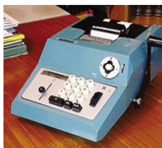
La calcolatrice prodotta dalla Olivetti