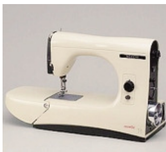
La macchina realizzata dalla Necchi