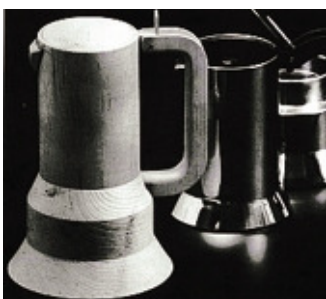
Il modello della caffettiera «9090»