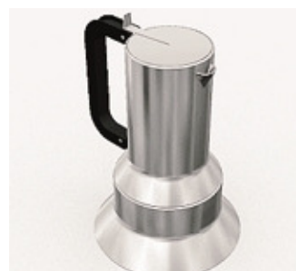
La caffettiera di Richard Sapper, prodotto di punta di Alessi