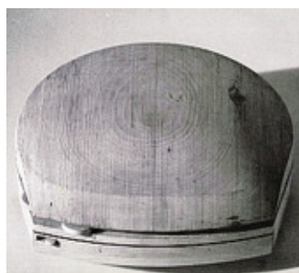
Il modello in legno di un mangiadischi