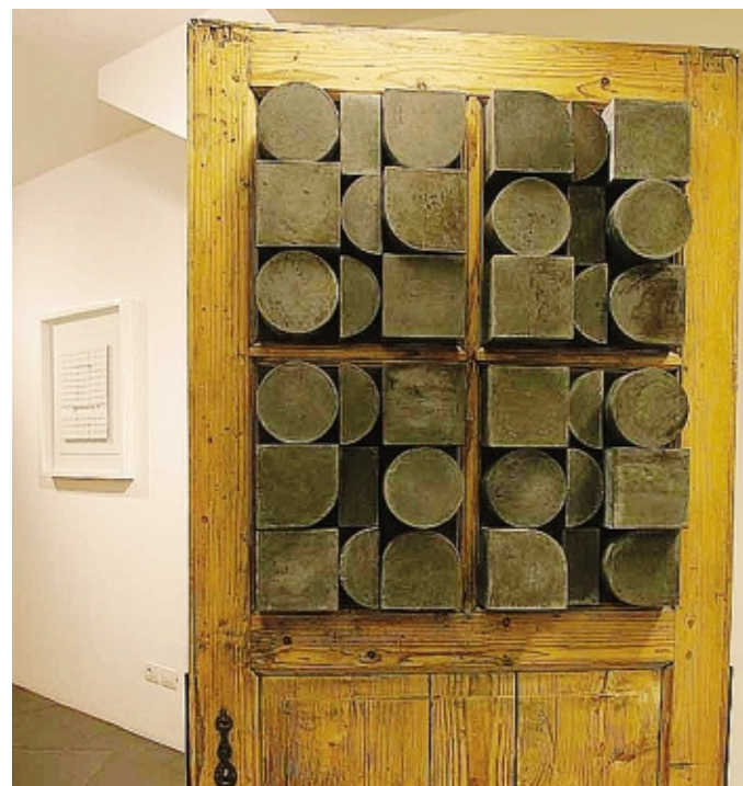
Un'opera di D. Pievani esposta alla Gamec nel 2009 BERGAMO FOTO