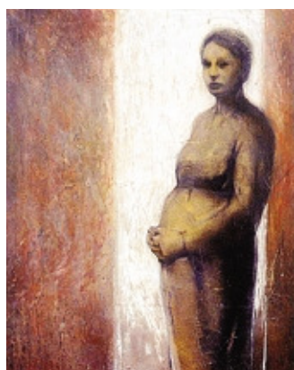
Bonfanti, «Donna in attesa»

Non vi è nulla che ci appartenga tanto strettamente e che, al tempo stesso, si sottragga a una presa definitiva quanto il nostro corpo: lo sperimentiamo in circostanze minime, per esempio quando ci riconosciamo con un attimo di ritardo nel monitor di una tv a circuito chiuso o in casi più impegnativi, come quelli dell'innamoramen-