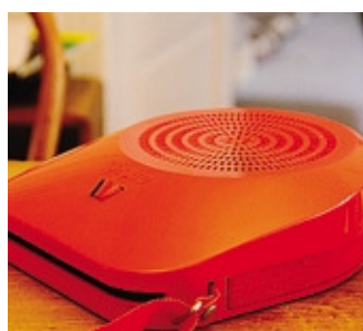
Il lettore di dischi di vinile a 45 giri della Ultravox