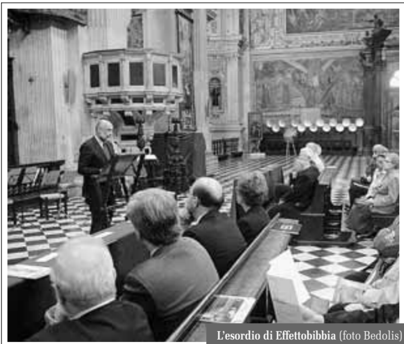
L'esordio di Effettobibbia

Il vescovo Roberto Amadei ha sottolineato «il valore ecumenico di Effettobibbia, che si avvale dei contributi di diverse Chiese sorelle e, da parte cattolica, anticipa il tema del Sinodo dei vescovi del prossimo ottobre, dedicato a La Parola di Dio nella vita e nella missione della Chiesa». Il sindaco Roberto Bruni ha invece parlato di Effettobibbia come di «un'iniziativa di grande valore culturale e promettente per il suo approccio interconfessionale: è importante, tra l'altro, che Bergamo ospiti un confronto di alto livello tra il patriarca di Venezia Angelo Scola, il rabbino capo di Milano Alfonso Arbib e il teologo valdese Paolo Ricca» (la tavola rotonda è in programma domenica 18 maggio alle 17.30 al Centro Congressi Giovanni XXIII). Il pastore della Comunità cristiana evangelica di Bergamo, Salvatore Ricciardi, ha ribadito le finalità culturali di Effettobibbia: «Potrebbe però anche succedere - ha aggiunto - che alcuni uomini e donne trovino nel confronto con la Parola che risuona in questi testi l'occasione per attuare una svolta esistenziale nel segno della fede. Se accadesse, ne sarei ben felice». Quanto al professor Giuseppe Pezzoni, presidente della Mia