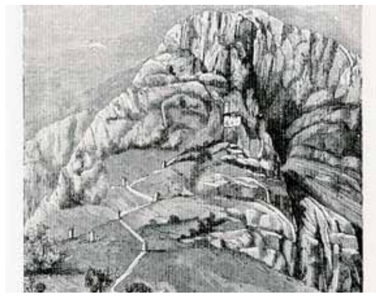
La salita al santuario, disegno di fine Ottocento