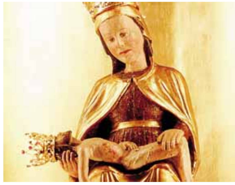
La piccola statua della Madonna della Cornabusa è del XIV secolo